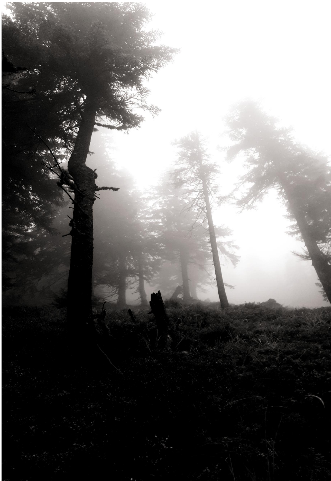
Error in calculo - Petr Wolf