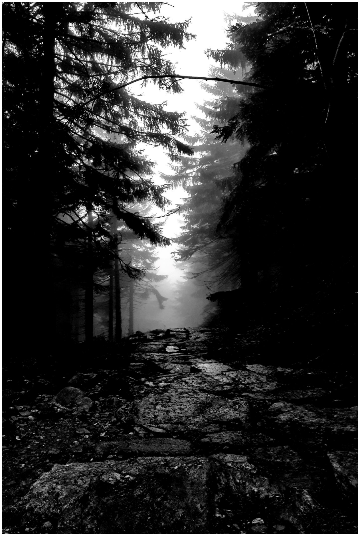
Error in calculo - Petr Wolf